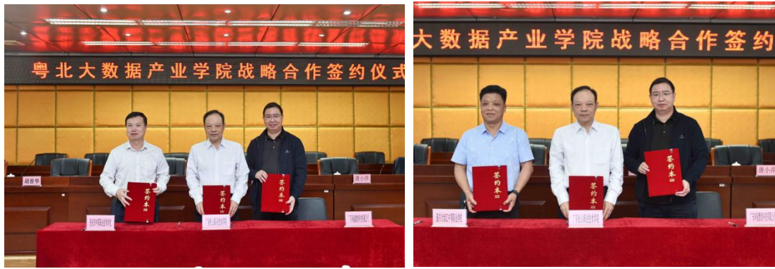
图 4 粤北大数据产业学院中高职签约仪式