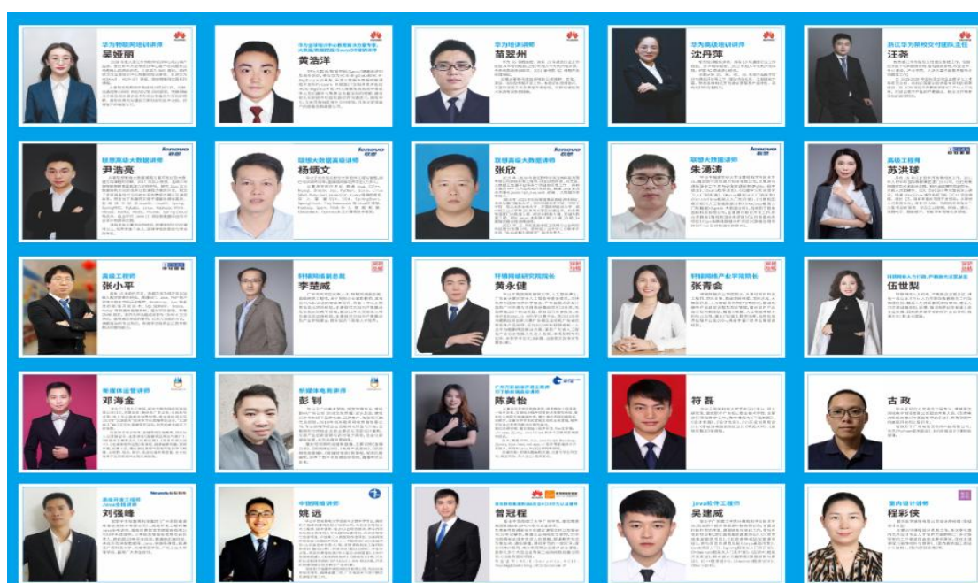
图 2 校企师资混编团队