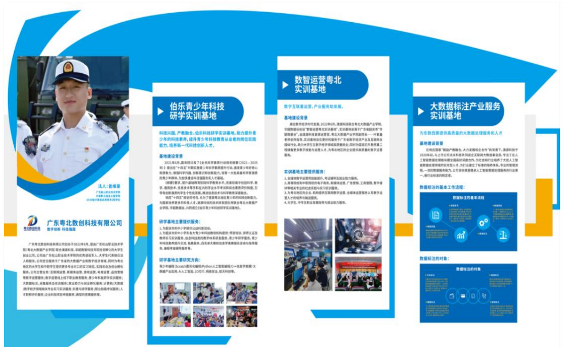
图 7 广东粤北数创科技有限公司（大学生创业项目）