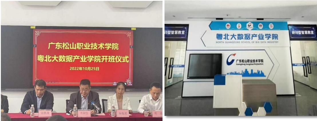
图6 华韶数据谷 产业学院基地建设