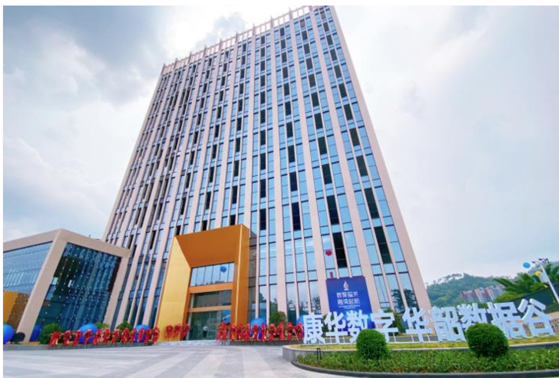
图 1 广东华韶数智科技有限公司（华韶数据谷）

产业学院共建基础上，双方还共建了大数据产业产教融合创新平台。平台以支撑省级高水平专业群——大数据技术专业群建设为目标，将粤北大数据产业学院和松山学院校内大数据全产业链实训基地建设成设施设备先进、资源集聚集优、团队结构优化、管理集约高效的产教融合实训基地，以产教融合实训基地为载体，面向学校、企业和社会提供学生实训、师资培训、技能竞赛、职业培训、技能等级认定等公共服务，打造产教融合创新平台，形成可复制、可借鉴的建设改革经验和模式，支撑专业群高质量发展，促进韶关数字经济产业繁荣发展，如图 1 所示。