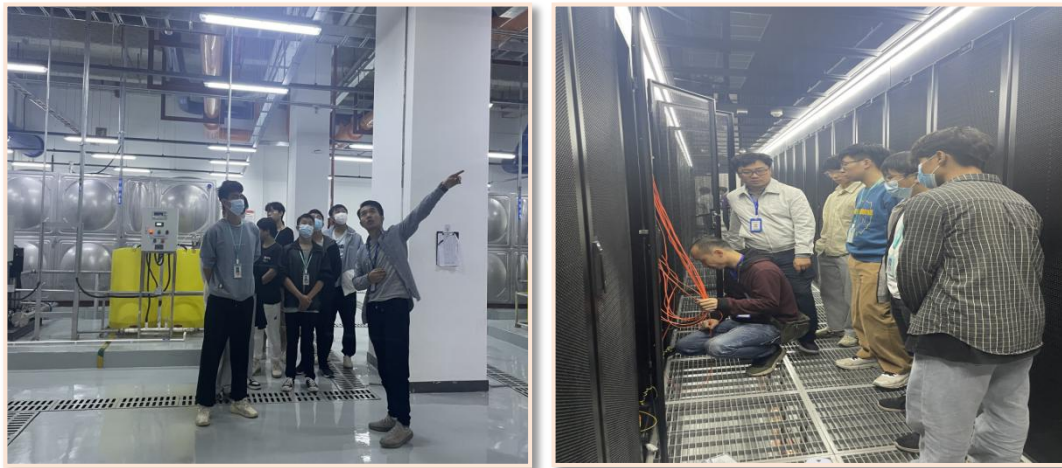
图 8 产业学院学生数据中心实习