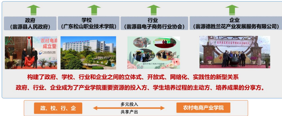
图 1 农村电商产业学院政行校企多元共治机制

联合培养，协同育人。农村电商产业学院立足人才培养“源于产业需求、服务产业需求”，校企双师共同施教，开展项目班、订单班、现代学徒制等人才培养方式，实施“企业出题、教师接题、学生答题、企业改题”实境式育人过程，助推学生就业创业零过渡。通过“双主体、双身份、双导师、双课堂、双管理、双考核”等的“六双”协同育人，实现了“三个转变”，即学生转变为新农人，教师转变为新农匠，课堂转变为工坊式课堂，培养出“爱农村、懂市场、善技术、会分析”的高端技术技能人才。