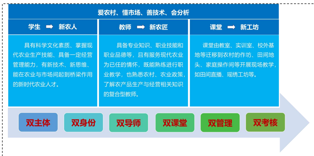
图 2 农村电商产业学院“三新六双”育人模式

联合培养，协同育人。农村电商产业学院立足人才培养“源于产业需求、服务产业需求”，校企双师共同施教，开展项目班、订单班、现代学徒制等人才培养方式，实施“企业出题、教师接题、学生答题、企业改题”实境式育人过程，助推学生就业创业零过渡。通过“双主体、双身份、双导师、双课堂、双管理、双考核”等的“六双”协同育人，实现了“三个转变”，即学生转变为新农人，教师转变为新农匠，课堂转变为工坊式课堂，培养出“爱农村、懂市场、善技术、会分析”的高端技术技能人才。