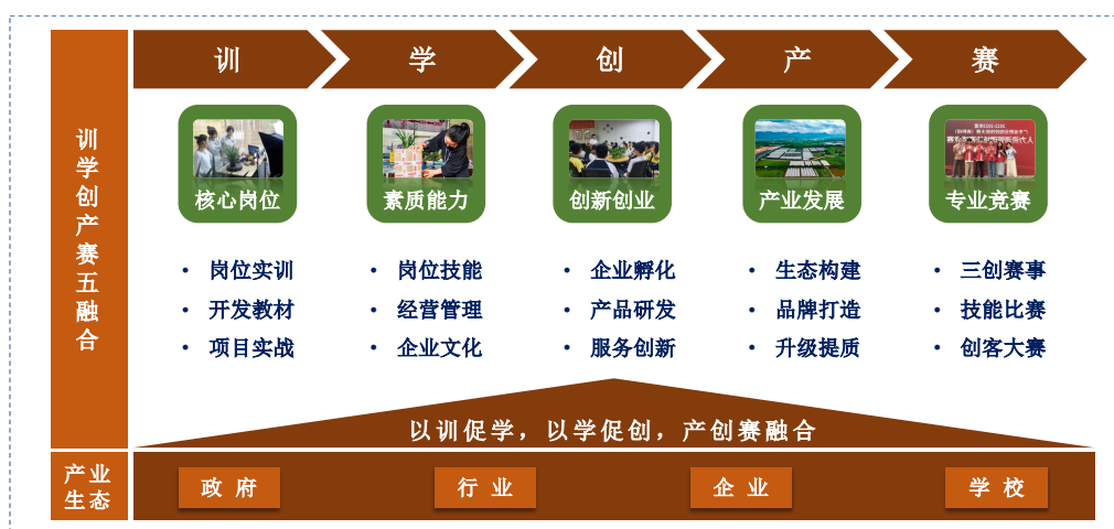
图3 农村电商产业学院产业生态

对接区域重点产业，全面推进教学改革。建设电子商务省级高水平专业群，精准对接区域重点产业。学校协同参与农村电商产业学院项目建设的企业群，根据典型农村电商的典型工作岗位和对应的职业能力共同制定人才培养方案，做到“专业设置、人才培养与市场需求相对接”。引导学生参加全国大学生电子商务“创新、创意及创业”挑战赛、专业技能大赛、创客大赛等赛事活动，鼓励学生开展创业尝试。通过训学创产赛融合，培养符合乡村振兴需求的人才。